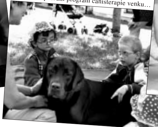
Odpolední program canisterapie venku...