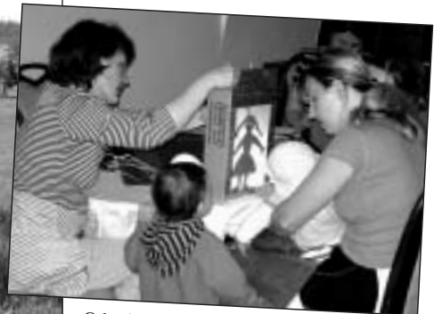
Odpolední program stimulace zraku – stínové divadlo k písničce „Když jsem já sloužil ....., vysloužil jsem si děvčátko za to“