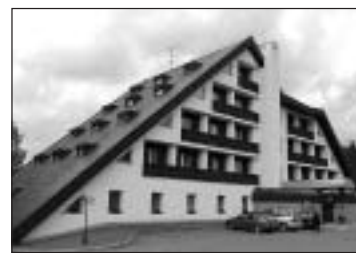
Hotel Mesit V Horní Bečvě

Výměna zkušeností, získání nových zkušeností – 8x Práce dětí v kolektivu, možnost zažít dítě v kolektivu – 3x Získání nových informací, rad, nápadů – 3x Společná setkání – 2x Povídání si s poradci, sblížení se s nimi – 2x Zkušenosti stimulační Setkání s jinými dětmi a psy Večerní programy Že i nevidomý člověk je součástí normálního života a že mnohé zvládne, pokud mu pomůžeme Podpoření chuti do další práce s dítětem Poznala jsem zase lépe svého syna Zapojení celé rodiny Relaxace v příjemné krajině, příjemné ubytování, Příjemná atmosféra, Odpočinek 2x Zjistila jsem, že mám veselé, pohodové dítě, které u zajímavých činností vydrží (na rozdíl od domova, kde je roztěkané) a zapojuje se, nepere se s dětmi a je celkem přátelské a plno věcí ho zajímá a baví Velká pohoda