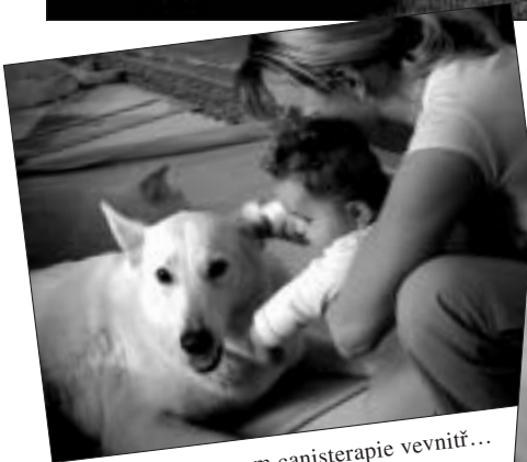
Odpolední program canisterapie vevnitř...