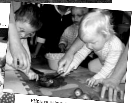
Příprava oslavy narozenin ve skupince – výroba dortu...byl moc dobrý!