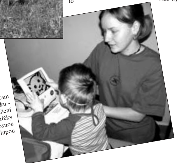
Odpolední program stimulace zraku - prohlížení obrázkové knížky malou přenosnou kamerovou lupou