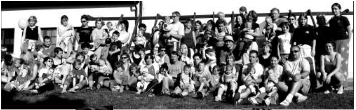
Společné foto – téměř všichni pohromadě...