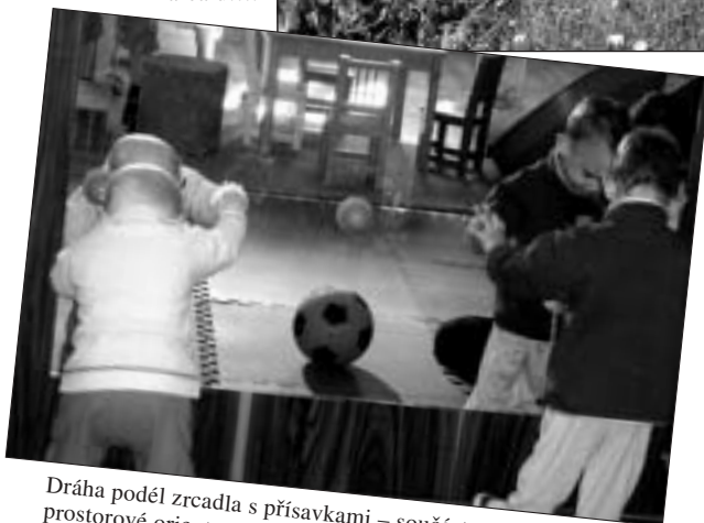
Dráha podél zrcadla s přísavkami – součást programu prostorové orientace.