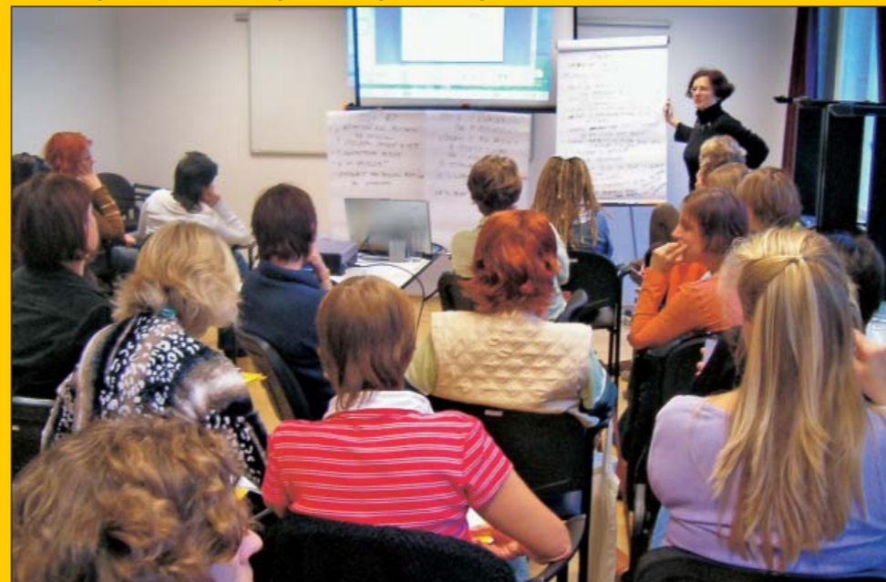
Seminář pro zaměstnance Společnosti pro ranou péči